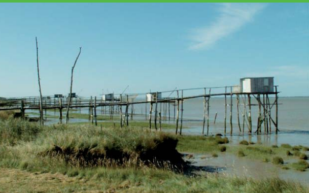
Port de Conac