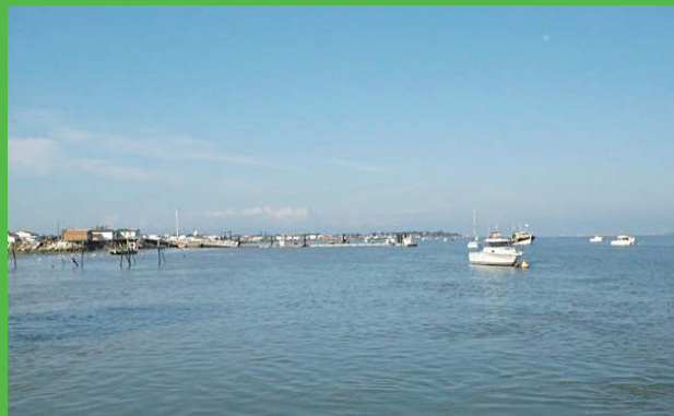
La Charente vers Port-des-Barques

Roger TOUZEAU 15 rue Paul Bert 17300 ROCHEFORT ☎ 05 46 87 38 04